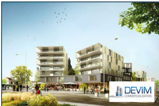
Visuel programme place de la Boule