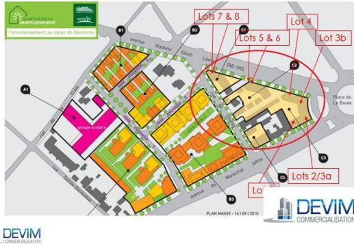
Commerce 4 : 303,30 m 2