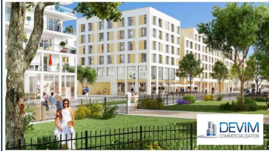
Visuel Programme A3

Livraison à partir du 1er trimestre 2020